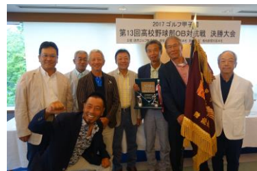
昨年初優勝の明星高校

甲子園出場を目指した高校野球部OB集合！ 統廃合後でも当時の高校でご出場いただけます。 ゴルフの巧拙は不問です。お気軽にご参加ください。