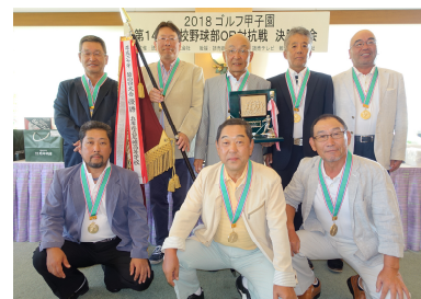
昨年初優勝の八尾高校

甲子園出場を目指した高校野球部OB集合！ 統廃合後でも当時の高校でご出場いただけます。 ゴルフの巧拙は不問です。お気軽にご参加ください。