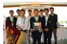
初優勝の関西学院高等部