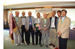
初優勝の明石高校