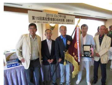
第15回大会で6度目の優勝の三田学園高校

甲子園出場を目指した高校野球部OB集合！ 統廃合後でも当時の高校でご出場いただけます。 ゴルフの巧拙は不問です。お気軽にご参加ください。